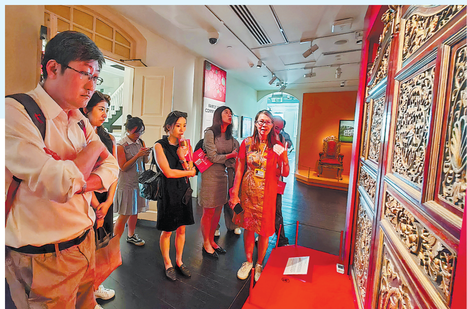
采访团参观土生华人博物馆。

各美其美,美美与共。各族群人们在这里和谐安居,形成了一个文化丰富、多姿多彩的新加坡。