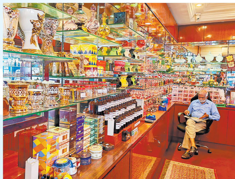
新加坡小印度及甘榜南文化区的印度商店