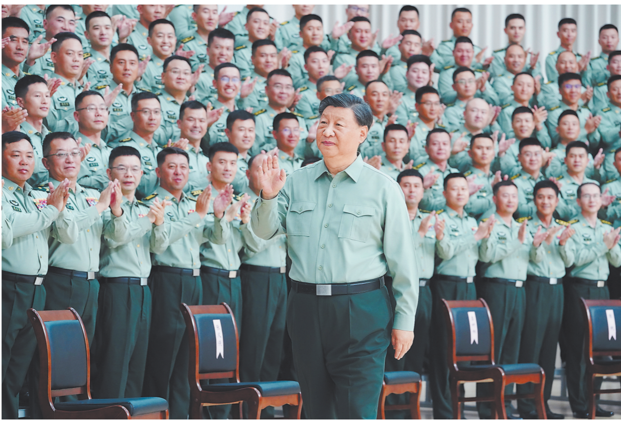
9月8日，中共中央总书记、国家主席、中央军委主席习近平到78集团军视察。这是习近平亲切接见78集团军官兵代表。