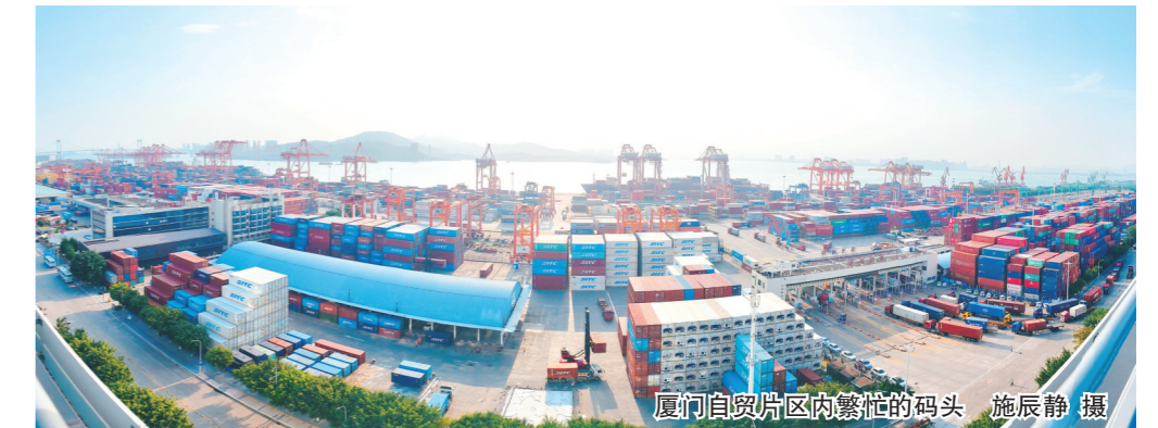
厦门自贸片区内繁忙的码头

截至目前,厦门自贸片区已累计推出创新举措553项,其中全国首创142项。厦门自贸片区管委会党组书记、主任何东宁表示,未来,厦门自贸片区仍将对标国际标准,充分发挥“多赛区+优