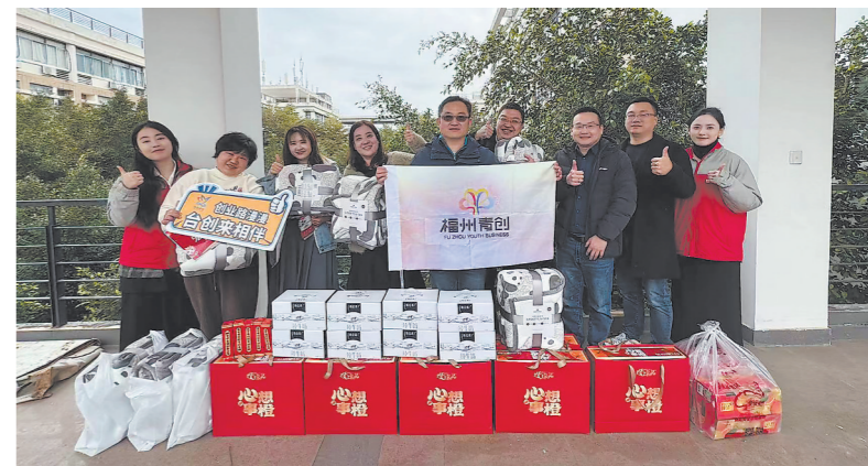
近日,由晋安团区委、福州青创(台创)中心和中建国投联合主办的“龙腾四海,宏图大展”2024迎新惠台利民政策宣讲活动周在福州举办。其间,有关人员走进福州台青创业基地、台湾教师所在高校、福州台协会等,探访、慰问在榕创业就业的台胞,开展涉台政策解读宣讲、现场答疑等活动。图为主办方走进福州大学,探访、慰问台湾教师。本报记者 吴洪 摄

岸关系在选后获得改善。该报建议,通过两岸民间交流,缓解紧张局势,如尽快兑现撤除陆团客禁令、恢复大陆居民赴台个人游和团队游等承诺。该文章进一步表示,两岸经贸需要交流,也必须交流。两岸产业连结深厚,因应大陆对台贸易壁垒调查结果,赖清德上台后应主动取消不合理的市场保护措施,缓和两岸关系。《工商时报》社论也指出,为使台湾不再错失更多发展契机,缓和两岸关系是当务之急。欲重启两岸对话协商,必须先承认两岸同属一中,承认“九二共识”。《联合报》社论则指出,若赖清德仍照以往的思维蛮干,他遇到的施政阻碍和民怨只会持续加剧,并烧向整个民进党。