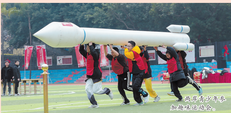
两岸青少年参加趣味运动会。