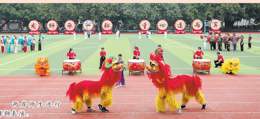
两岸师生进行舞狮表演。