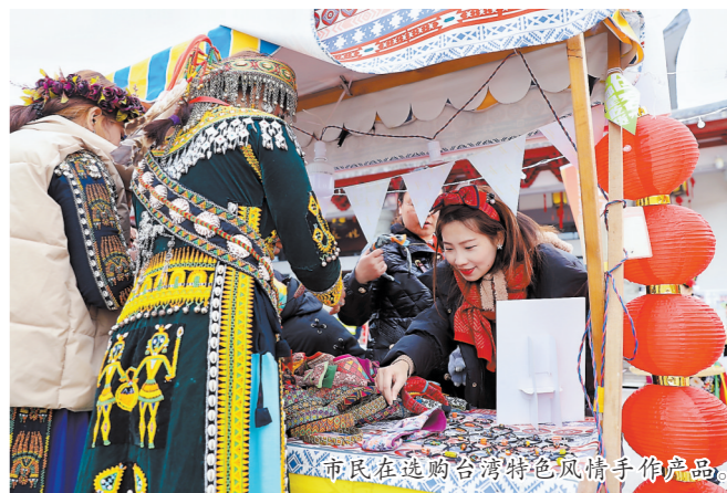
市民在选购台湾特色风情手工作品。