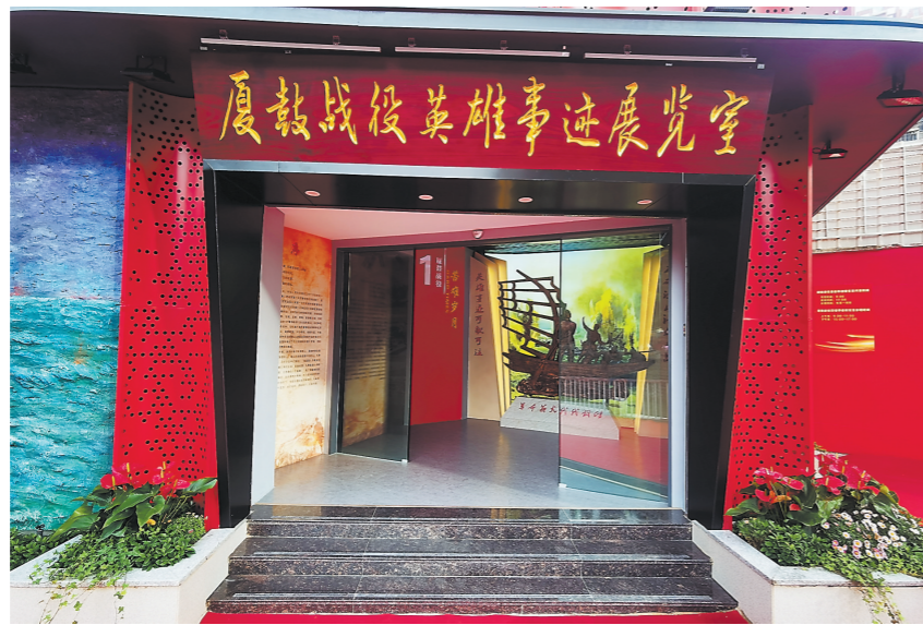
厦鼓战役英雄事迹展览馆