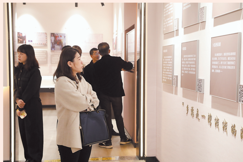
游客参观“迁台记忆”东山专题档案文献展。

2022年,东山县档案局组建两岸家书故事编委会,由当地10余名作家、学者、文史研究员组成编委工作组,研读400多封两岸家书,从中挖掘