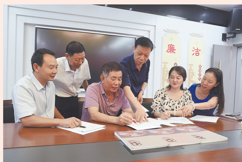
两岸家书故事编委会成员在探讨家书故事。

故事线索;走遍了全县61个建制村,入户采访上百次,查阅各种文史资料,反复斟酌推敲。目前,已采写了48篇动人的两岸家书故事。《一管洞箫的传奇》《我为两岸离散亲人传书》……一封封两岸家书背后的真实鲜活故事被挖掘、活化,故事中生动的情节、真挚的情感,将当年悲欢离合、酸甜苦辣再现在读者眼前。