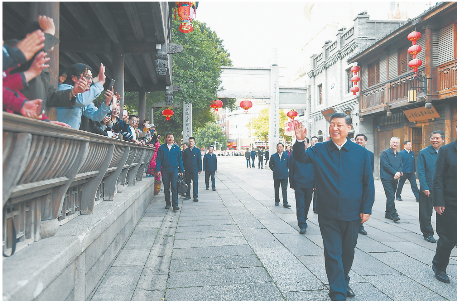
2021年3月22日至25日,中共中央总书记、国家主席、中央军委主席习近平在福建考察。这是24日下午,习近平在福州三坊七巷历史文化街区考察时,向游客和市民招手致意。