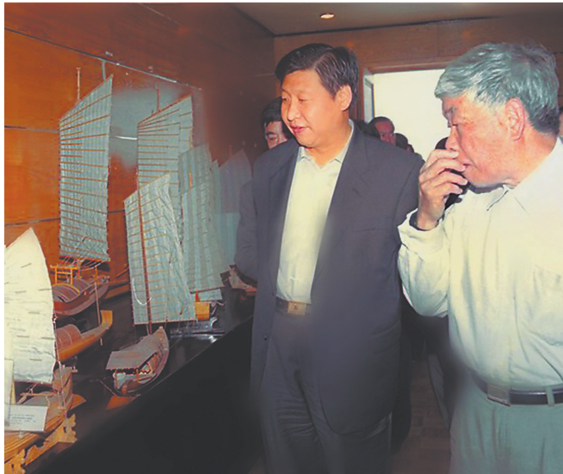
2001年4月,习近平到泉州海外交通史博物馆考察。