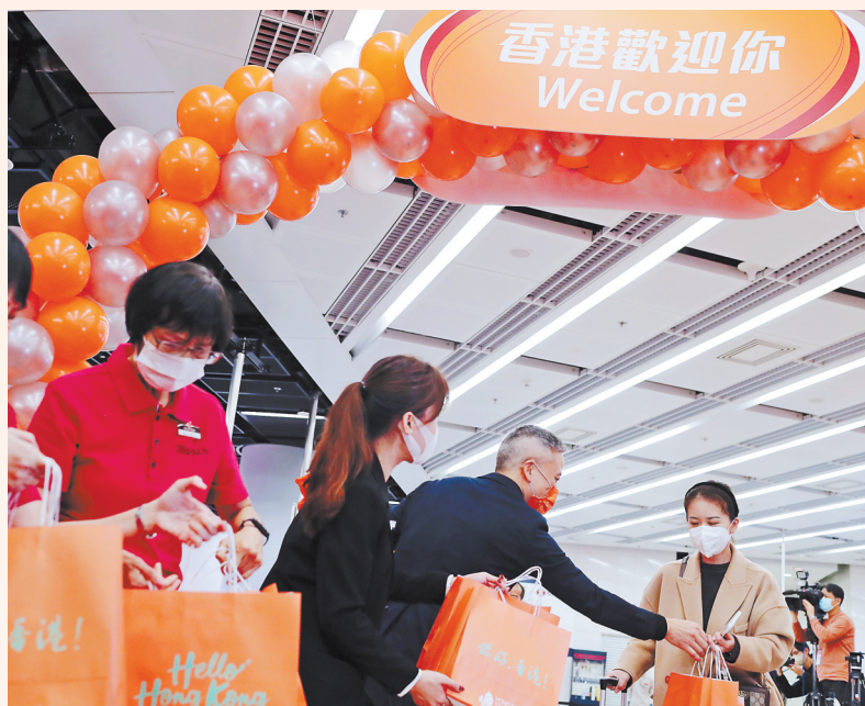
15日,在香港的西九龙站,工作人员迎接恢复通车后内地驶往香港首趟列车的旅客并赠送小礼物。 新华社发

在人流涌动的深圳北站,春运北上返乡客流中,南下的G5607次列车显得尤为特别。这是广深港高铁恢复通车后从内地开往香港的首趟列车。