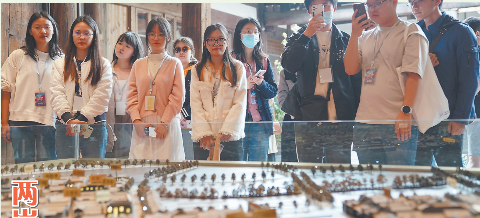
两岸青年在福州三坊七巷参观。

本报讯(记者 刘深魁 文/图) 近日,两岸青年社区治理交流活动在福州举行,台湾青年里长、社区志工、马祖乡亲代表和厦门大学台湾研究院两岸学生及福州社区代表等近百人欢聚一堂,共同探讨社区治理的新理念和新模式,分享成功案例和治理经验。