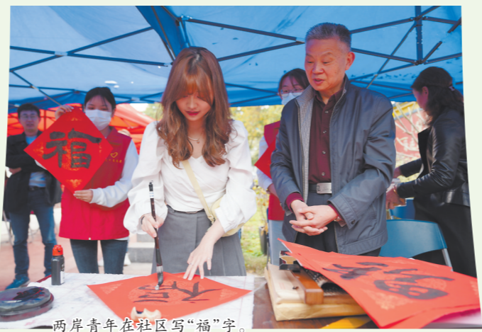
两岸青年在社区写“福”字。