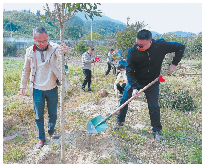
13日,2023海峡两岸融合发展植树节在福州市连江县举行,近百名台商台青参加活动,与大陆同胞共同植下一片“同心林”。

“闽台融合发展研究基地”设立在福建师范大学闽台区域研究中心,今后将通过加强学术研究和实践探索,挖掘闽台融合发展的丰富内涵、核心价值和功能意义,为福建探索海峡两岸融合发展新路打造知识库、人才库、信息库及思想库。