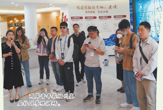
两岸青年在福州鼓楼区社区参访调研。

近年来,社区治理是两岸交流合作的热门话题,越来越多的台湾同胞参与到大陆社区治理的事业中来。在本次活动期间,福州市仓山区金山街道金洲社区居民委员会与台湾台中市北区赖旺社区发展协会签署了合作协议。下一阶段,双方将从加强社工组织联系、建立志愿服务机制、搭建青年交流平台、促进多元文化交流四个方面,共创两岸和谐社区,共同推动两岸社区融合发展。