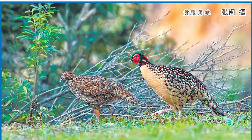
黄腹角雉

记者从工信部门了解到,截至今年3月,“光储充检”智能超充站已在福州台江金融街、福州火车站、福州马尾物联网中心、福州快安公交总站、宁德市锂电小镇、宁德会展中心等地建成投用。此外,位于福州马尾江滨大道的站点将建成我省首个将屋顶光伏、家用储能、户外储能、新能源汽车充电、汽车电池在线检测、汽车充电产品线下体验、户外低碳露营等功能集于一体的线下“低碳科技生活体验中心”。