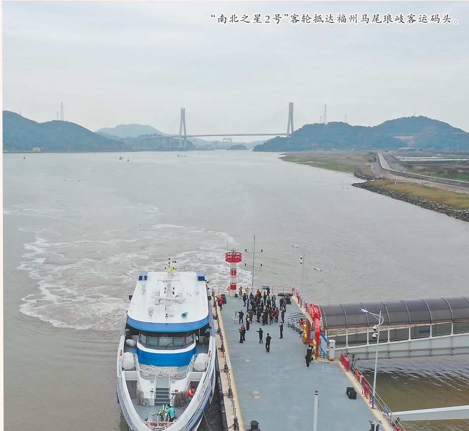
“南北之星2号”客轮抵达福州马尾琅岐客运码头。

除科学馆的纪念展外,本月中还将推出社区巡展,走进社区宣传推广基本法。逢周日,澳门律师公会将派员在巡展现场为居民提供法律咨询。