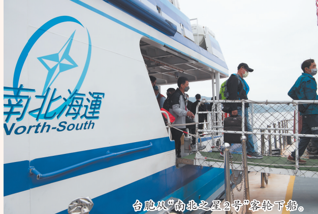
台胞从“南北之星2号”客轮下船。