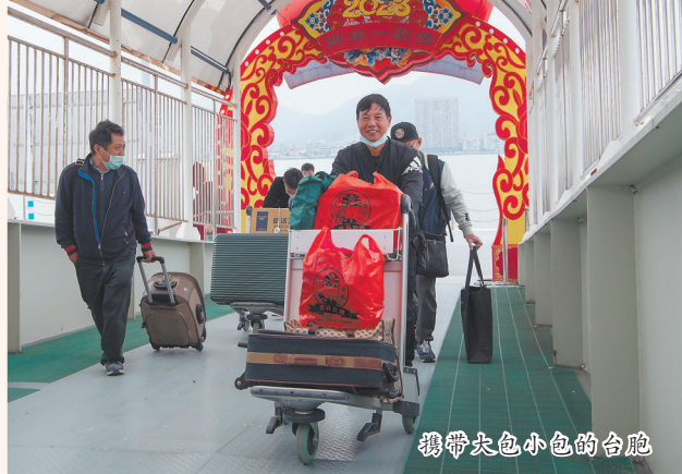
携带各色小包的台胞