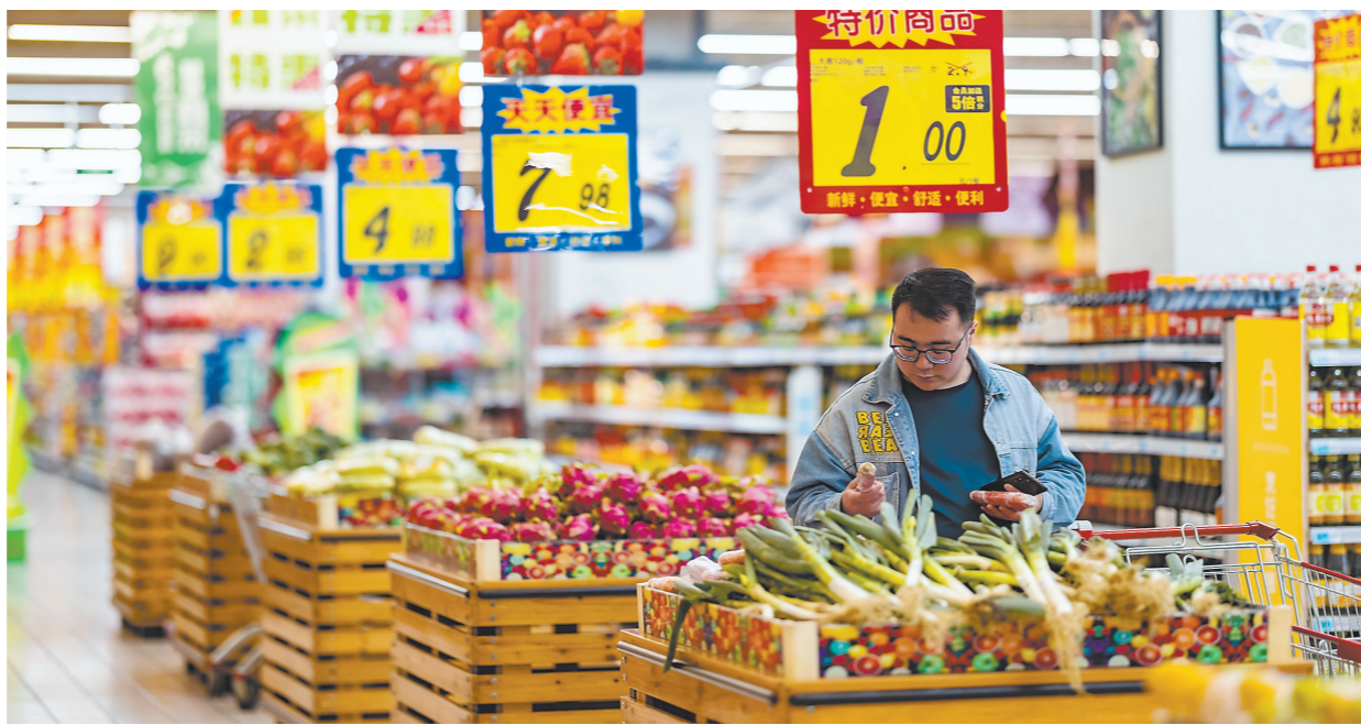
11日,消费者在贵州省安顺市西秀区一家超市选购蔬菜。国家统计局4月11日发布数据,3月份,全国居民消费价格指数(CPI)同比上涨0.7%,涨幅比上月回落0.3个百分点;环比下降0.3%。1至3月份,CPI平均比上年同期上涨1.3%。

“今年以来,我国核心CPI同比涨幅一直处在1%左右的区间波动,这表明我国工业消费品及服务消费价格保持稳定。”国务院发展研究中心市场经济研究所副研究员王立坤说。