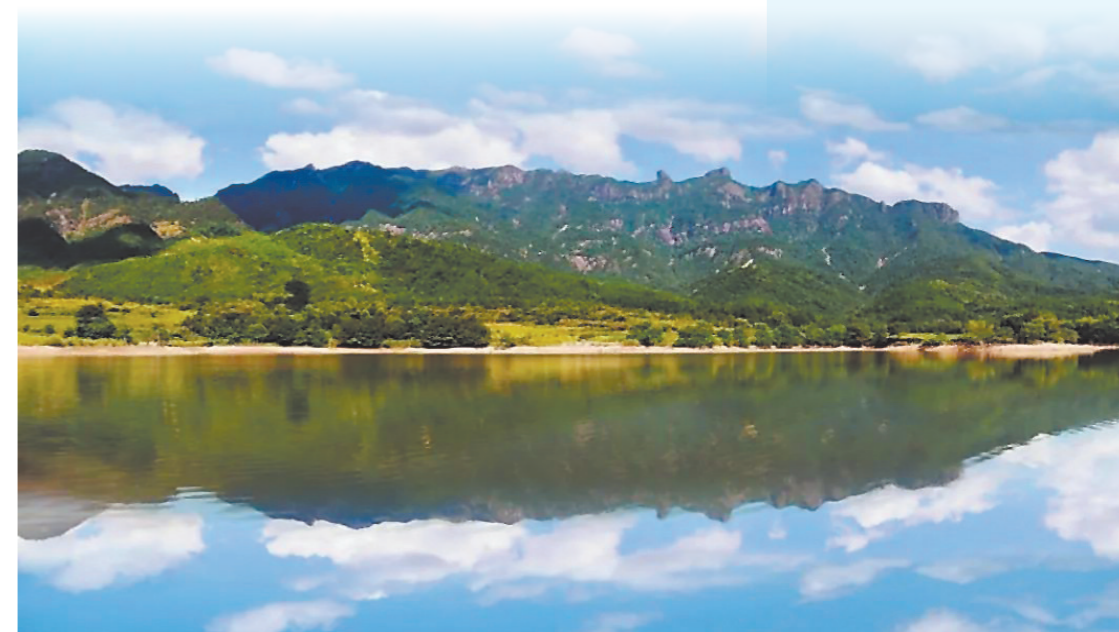
光泽拥有丰富的水资源。