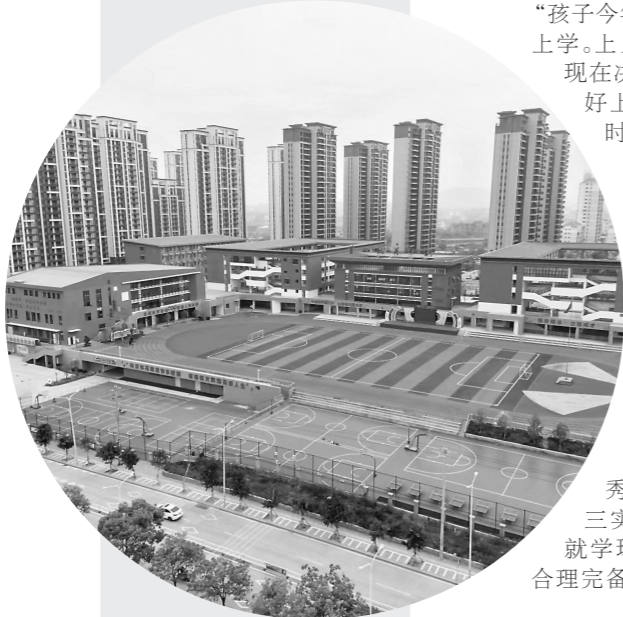
跻身莆田市公立龙头校的毓英中学

春潮涌动,万物启新。秀屿区委书记张伯松表示,今年要全面深入贯彻落实党的二十大精神,结合“深学争优、敢为争先、实干争效”行动,扎实抓好教育质量提升、校长教师队伍建设等重点工作,办好人民满意的教育,切实把教育惠民工程转化为百姓实打实的获得感,为奋力答好谱写“福建篇章”的秀屿答卷作出新贡献。