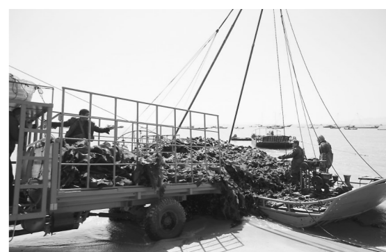
连日来,秀屿区南日镇沿海一片“海上春耕”的繁忙景象。南日镇支持保障水产养殖企业发展海带烘干工艺,采用净化、软化、熟化、脱水、干燥、盐渍、杀菌等一系列流程处理海带,解决了“看天气干活”的海带晾晒难题,大大提高经济效益。今年,南日镇海带养殖面积约8万亩,预计年产量可达9.5万吨,产值约10亿元。图为云村云万沙滩,村民在运输采收的海带。

据悉,此方案还为不同类别等级对象的残疾人家庭列出铺设盲道、地面平整及坡化等50多种无障碍改造参考项目,不同残疾人享受相应的无障碍改造项目,不同的改造项目也对应不同的补贴标准。具体补贴标准根据省级补贴目录中的补贴标准和残疾人家庭实际完成的改造项目的数量对残疾人家庭予以补贴。