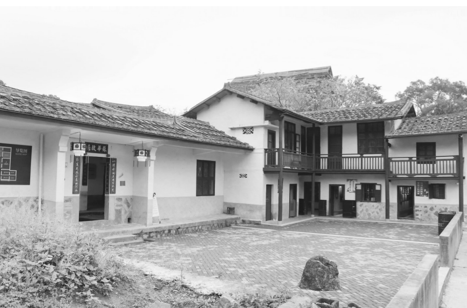
修缮一新的苏华故居

“三年来,莆田市民政局通过对30个红色文化遗址修缮保护和管护利用,有8个革命遗址被列为省党史学习教育参观学习点,接受群众参观人数超13万人次,社会效益显著。”莆田市民政局老区建设科科长郭志轩介绍说,今年莆田市延续设立专项资金3年,市民政局将统筹190万元省级革命遗址保护利用专项资金和500万元市级专项资金,继续对五座厝交通站、涵江联络站、闽中海上游击队等8个红色文化遗址进行修缮提升,做好其他26个红色文化遗址的管护利用,同时创新展示手段、增加体验项目,结合乡村振兴发展,助推红色文化产业再上新台阶。