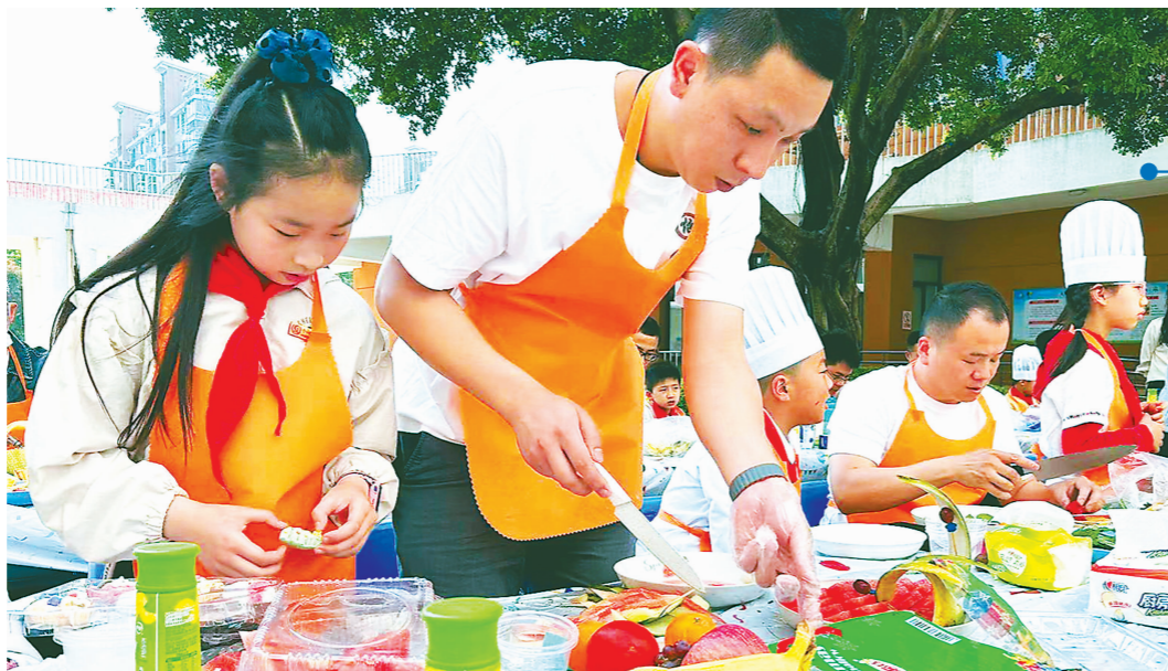
“好爸爸俱乐部”亲子厨房活动别开生面。

“我们的家庭教育工作围绕‘三个回归’,即让爱回归家庭、回归人与人之间平等尊重的关系、回归自己的内心世界,营造重视和关注家庭教育的氛围,提升家校共育质效。”仓山区教育局局长廖青表示,今年将深化家庭教育指导工作,加强协同育人全方位协作力度,从不同年龄段孩子的常见问题入手,支持和帮助家长树立科学的家庭教育观念、学习基础的家庭教育知识、掌握和运用有效的家庭教育手段和方法。