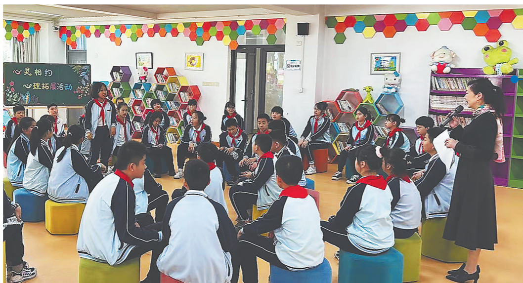
家长课堂现场,家长与学生各抒己见。