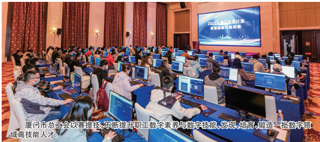
厦门市总工会以赛促技,不断提升职工数字素养与数字技能,发现、培育、锻造一批数字领域高技能人才。

以赛赋能、以赛促产,厦门市总工会带动百万职工投身数字经济发展新蓝海。厦门远海码头泊位上,5G无人驾驶集卡来