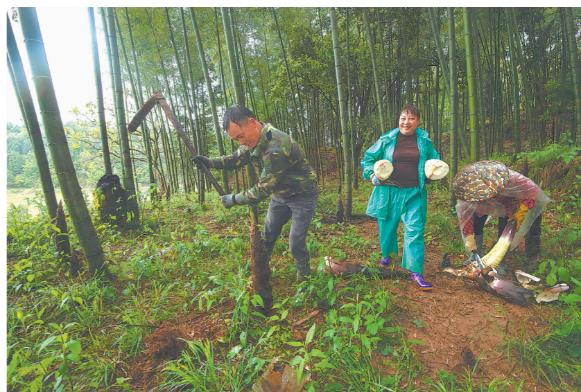
近日,在建宁县溪口镇半元村竹山上一根根竹笋破土而出,农户一大早就赶来挖笋。建宁是山区农业县,自然条件优越,森林资源丰富,笋竹产业是当地的一大特色产业。建宁县毛竹林面积35万亩,一季度共生产2093吨笋干,县内还涌现出华新、孟宗、富源等11个笋制品规模以上加工企业,带动经济发展的同时也让农民的腰包鼓起来了。

同时,省文化和旅游厅还发布了福建省旅游景区“微信搜一搜”功能上线消息。即日起,网友通过“微信搜一搜”搜索福建景区名称,如“鼓浪屿”“三坊七巷”等,即可直接从展示页面跳转门票购买、预约或语音导览功能。目前该功能已上线覆盖福建5A/4A景区30多家,后续将陆续覆盖其他旅游景区。