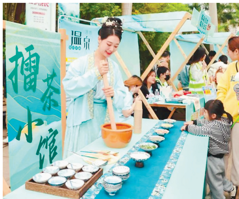
活动现场举办的具有福建地方特色的擂茶活动

本报讯(记者 郭斌 文/图) 2023年福建省文旅经济发展大会的配套活动之一——“来福建 享福气 自由自在好生活”四季(春季)营销推广活动22日在福州启动。