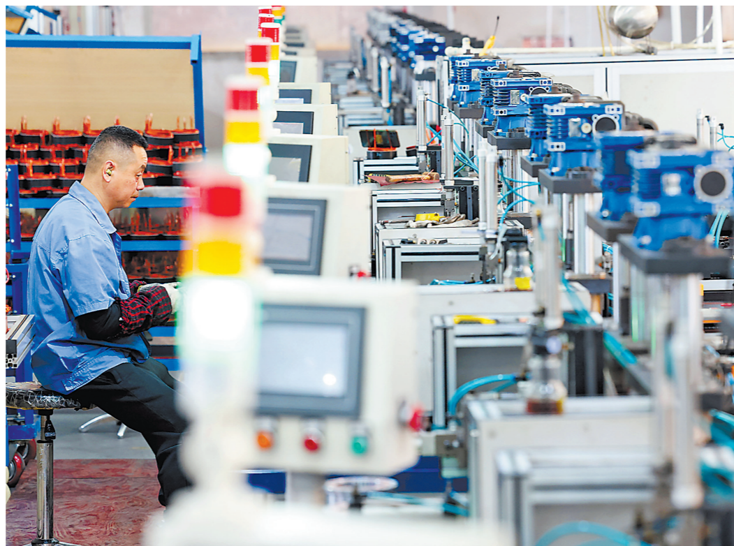
近日,在柘荣县一家电机生产企业,工人正在赶制订单。近年来,柘荣县持续创新服务手段、落实优惠政策、送达政策红利,助力电机企业“智”向远方、“创”造未来。

2014年12月,哈纳斯莆田液化天然气接收站项目在闽宁协作第18次联席会议项目签约仪式上成功签约,并被列入国家《天然气发展“十三五”规划》。2021年12月14日,该项目获得国家发展改革委核准,标志着闽宁协作迈出了新的重大步伐,开始由单向投资转变为双向互助,对促进东西部深化协作具有重要意义。