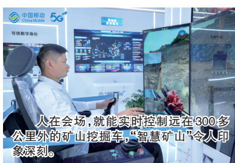
人在会场,就能实时控制远在300多公里外的矿山挖掘机,“智慧矿山”令人印象深刻。

使命凝聚力量,目标催人奋进。在迈向全面建设社会主义现代化国家、向第二个百年奋斗目标进军的新征程中,中国移动将积极服务和融入新发展格局,笃行不怠、不负时代,踔厉奋发、不负人民,助力书写网络强国建设新的宏伟篇章。(王柳欣)