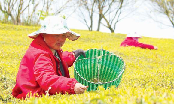
日前,福鼎市佳阳畲族乡天湖山上层叠的茶田中,茶农忙着采摘贡眉。

在环境配套方面,泉州将完善遗产点智慧讲解系统,构建“多彩公交+慢行步道”城市交通微循环,围绕“吃住行游购娱”,合理布设民宿餐饮空间,特别是制定出台《古城及周边旅游配套提升专项行动方案》,盘活中心城区23万平方米闲置国有资产改造为精品酒店、民宿,加快补齐中心城区旅游公共配套短板。