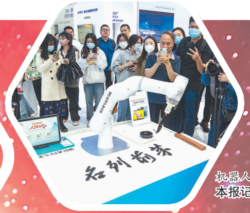
机器人写毛笔字。本报记者 林熙 摄