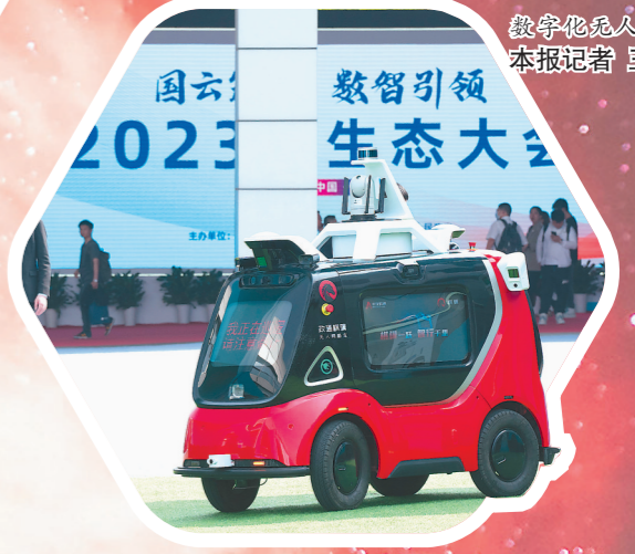
数字化无人网格车。