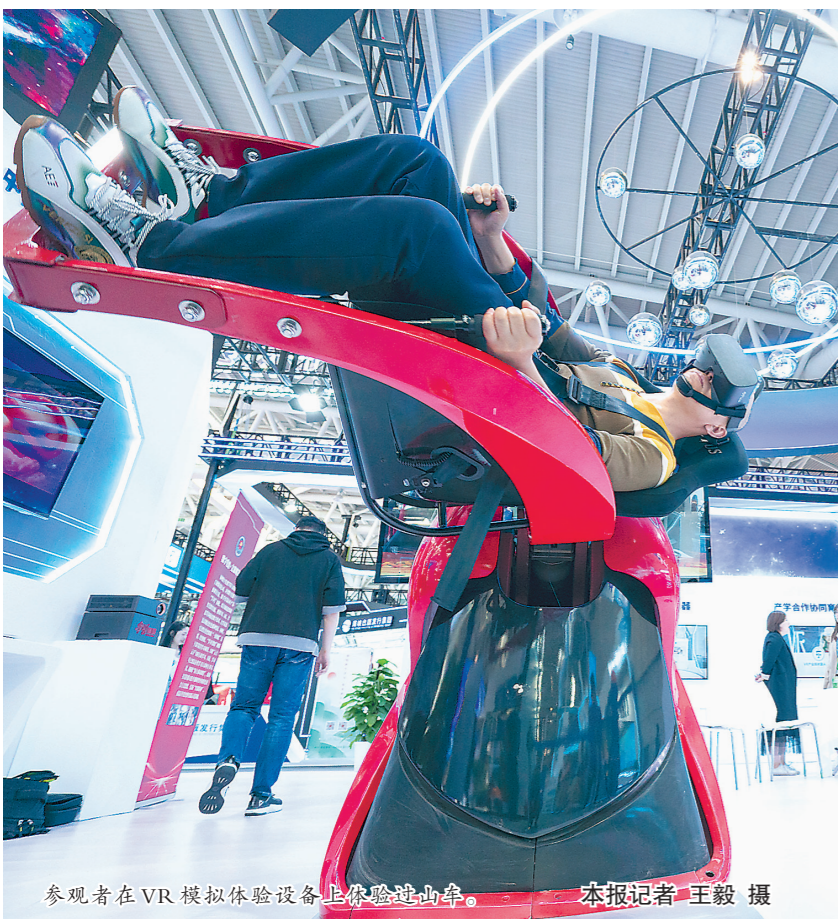
参观者在VR模拟体验设备上体验过山车。本报记者 王毅 摄