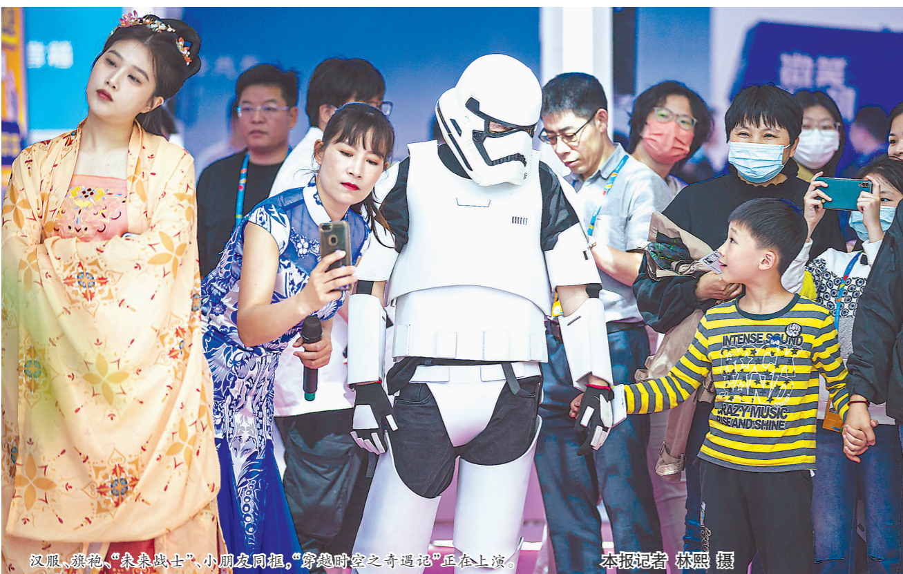
汉服、旗袍、“秦皇战士”,小朋友同框,“穿越时空之奇遇记”正在上演。