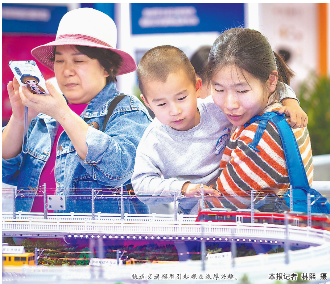
轨道交通模型引起观众浓厚兴趣。