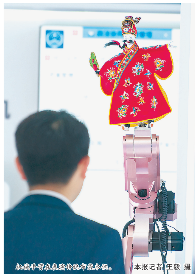
机械手臂在表演传统布袋木偶。