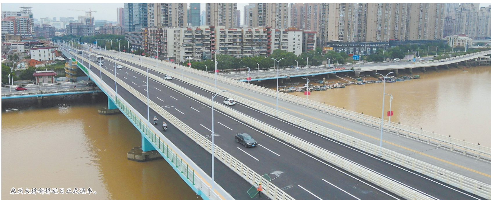
泉州大桥新桥近日正式通车。