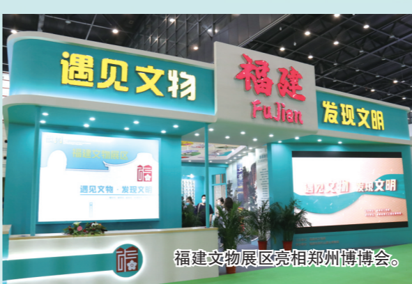
福建博物院展区亮相郑州博博会。

全省已实施80个可移动文物项目文物保护能力稳步提升。大力发展国有博物馆智慧化建设，加快博物馆与AR、VR等前沿技术融合，不断激发博物馆发展活力。同时与高等院校、科研院所深化合作，建设文物内容数据库，通过数字化手段，对文物进行信息化管理和数据统计分析。