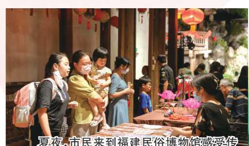
夏夜，市民来到福建民俗博物馆感受传统手工艺魅力。

为进一步发挥博物馆的社会服务功能，更好地满足人民群众精神文化需求，近年来，省文物局结合实施“深学争优、敢为争先、实干争效”行动，将博物馆错时延时开放工作纳入年度重要工作事项。2022年试点的12家博物馆总结经验做法，动态调整试行方案，精心策划主题活动；今年新增的13家博物馆积极主动对接，加强学习借鉴，努力为观众提供更具优质的公共文化服务。截至目前，25家试点博物馆均已实现错时延时开放，今年1—4月，累计参观人数达235万人次。