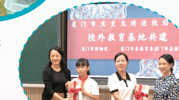
福建省博物馆文创联盟成立仪式。

成立福建省通史展览博物馆联盟、福建省博物馆文创联盟，加强博物馆资源整合与协同创新。全省各级博物馆积极主动开展交流展览、联合办展，取长补短。近年省文