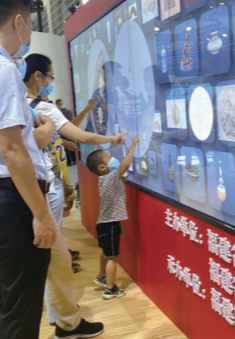
▲ 数字峰会期间，“福建省博物馆数字化成果展示”吸引了众多市民打卡。