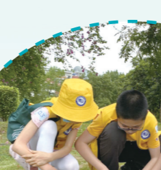
▲ 小学生在福建昙石山遗址博物馆体验考古发掘。

多次举办福建省博物馆馆藏文物保护培训班，提升馆藏文物保护管理水平；组织全省博物馆编制方案，实施可移动文物修复项目、预防性保护项目和数字化保护利用项目，有力提升可移动文物保护能力。近五年