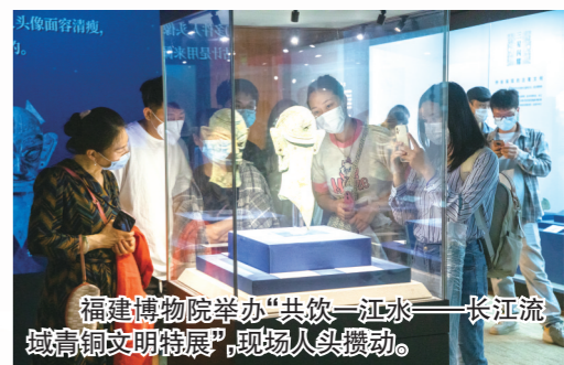
福建博物院举办“共饮一江水——长江流域青铜文明特展”，现场人头攒动。

博物院每年接待观众逾百万人次，现已成为福建省传播优秀传统文化、弘扬社会主义核心价值观、开展爱国主义教育、讲好中国故事、福建故事的重要阵地。