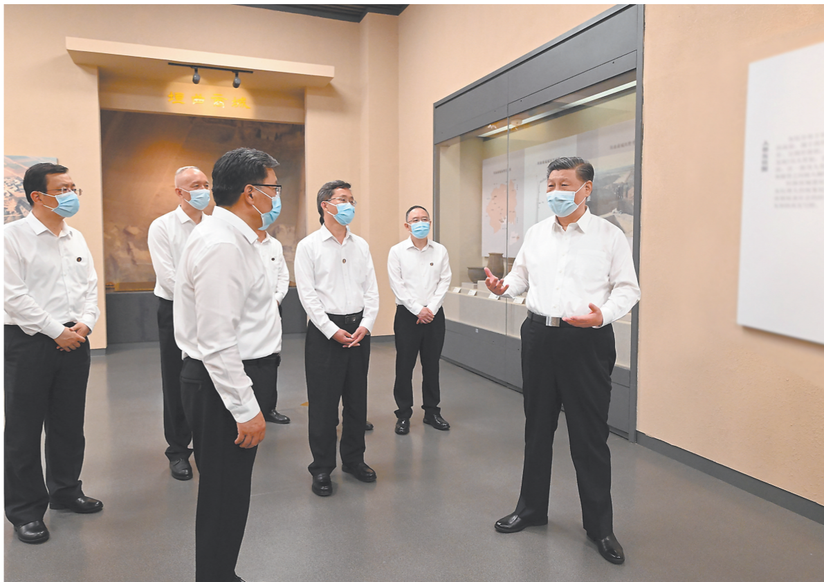
5月16日下午,中共中央总书记、国家主席、中央军委主席习近平在前往陕西西安主持中国-中亚峰会途中,在山西运城博物馆考察。

新华社陕西西安/山西运城5月17日电 中共中央总书记、国家主席、中央军委主席习近平在听取陕西省委和省政府工作汇报时强调,陕西在推进中国式现代化建设中要有勇立潮头、争当前时代弄潮儿的志向和气魄,奋力追赶、敢于超越,在西部地区发挥示范作用。要完整、准确、全面贯彻新发展理念,紧紧围绕高质量发展这个首要任务,着眼全国发展大局,立足陕西实际,发挥自身优势,明确主攻方向,主动融入和服务构建新发展格局,努力在实现科技自立自强、构建现代化产业体系、促进城乡区域协调发展、扩大高水平对外开放、加强生态环境保护等方面实现新突破,奋力谱写中国式现代化建设的陕西篇章。