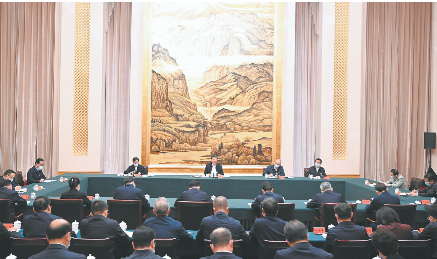
5月17日上午,中共中央总书记、国家主席、中央军委主席习近平在陕西西安主持中国-中亚峰会前夕,专门听取陕西省委和省政府工作汇报,发表了重要讲话。