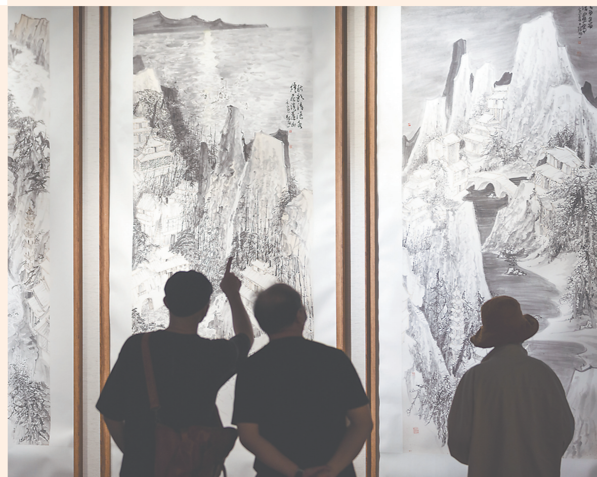
18日,《点石——陈北溪山水画作品展》在福州画院开幕。此次展览共展出著名山水画家陈北溪近50件山水佳作,其融合了传统与现代的艺术元素,以其独特的艺术视角展示了大自然的壮丽。图为观众在展馆内欣赏画作。

据悉,下一阶段,龙文区有关部门还将征求一些专家、学者、群众的意见与建议,对此剧进行打磨提升,争取打造出一幕文艺精品。