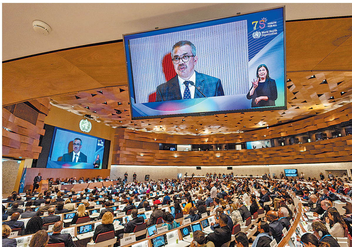
21日,在瑞士日内瓦,世卫组织总干事谭德塞在第76届世界卫生大会开幕式上讲话。第76届世界卫生大会21日在瑞士日内瓦开幕,本届大会的主题是“世卫组织成立75年:拯救生命,推动人人健康”。

马晓光表示,必须指出的是,台湾同胞是我们的骨肉天亲,没有谁比我们更关心他们的健康福祉。新冠疫情发生以来,我们最先邀请台湾卫生专家赴湖北武汉考察,分享了数十份技术资料,专程通报大陆与世卫组织分享病毒基因序列和获取相关基因序列途径的信息。截至2023年5月,我们已向台湾地区通报新冠疫情超过500次,包括在大陆确诊的台湾居民信息。过去一年,中国台湾医疗技术专家参加世卫组织技术活动共计24批。大陆方面还积极有序安排在大陆台胞免费接种疫苗,截至2023年2月,在大陆台胞累计接种疫苗47.9万剂次。可以说,台湾地区参与世卫组织技术领域沟通合作渠道充分畅通,获取各种疫情防控信息和支援的渠道完全有效,民进党当局所谓“国际防疫体系缺口”的政治谎言不攻自破。