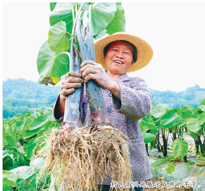
村民高兴展示成熟的芋子。

近年来,永定区立足辖区气候土壤实际,通过政策扶持、发展农民专业合作社、农村电商参与等方式,不断推动芋头产业特色化、规模化、品牌化发展。今年,永定全区种植“六月红”早熟芋达到4万亩,种植及加工销售产值超过4.5亿元,能够解决周边农户就业5000余人,成为当地群众增收致富的“金疙瘩”。