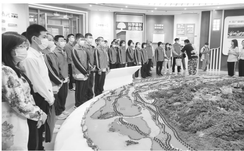
▲中学生到福州红庙岭开展研学活动,学习垃圾分类科普知识。

活动网络直播,举办了“让垃圾分类成为低碳生活新时尚”主题晚会,并进行网络直播;举行了“垃圾分类自治新模式”“环保讲师驾到”两场融媒体访谈直播;开展了一场十名城管进社区活动,面对面宣传垃圾分类知识;在福州地铁,开展一场“党建引领、省市多个党支部共建、共同推进地铁上的垃圾分类工作”活动。