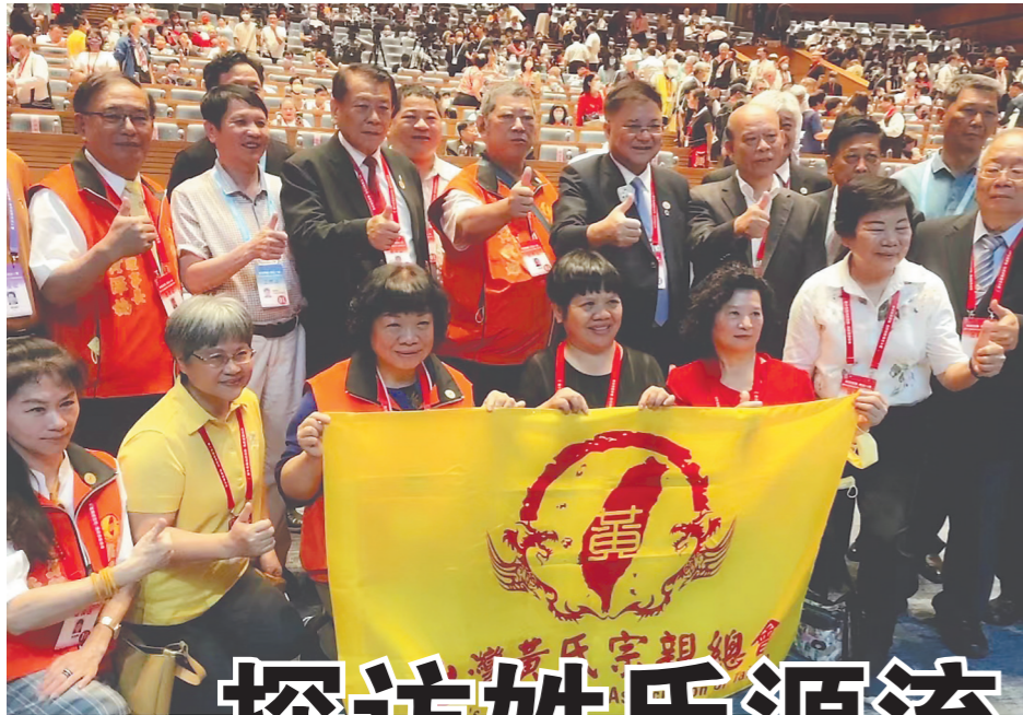
参加海峡百姓论坛的台湾宗亲在现场合影留念。