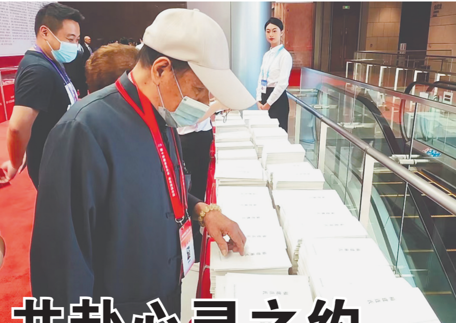
与会嘉宾在翻阅姓氏源流册子。