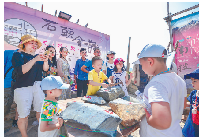
在“石头会唱歌”艺术聚落小院,游客在敲打“会唱歌”的石头。