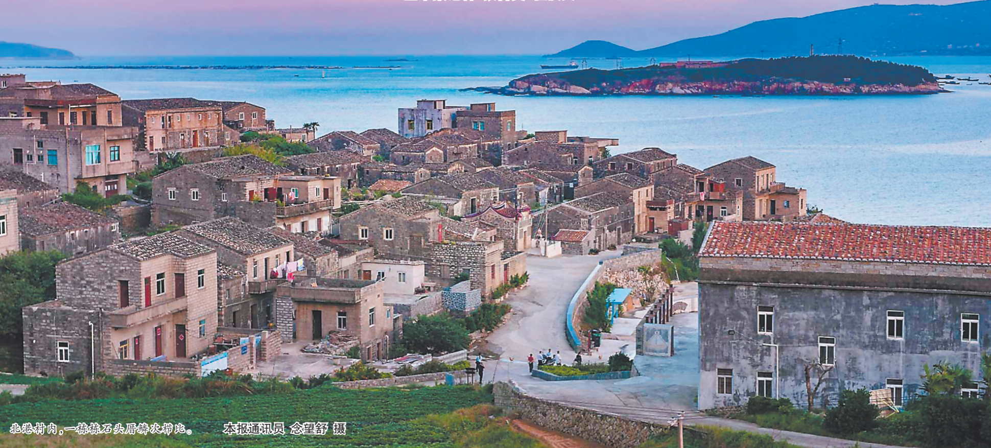
北港村,一栋栋石头厝错落有致。