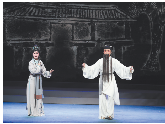
本报讯(通讯员 谢子丑)2日晚,梨园戏《陈仲子》的《汲水》一折,亮相在浙江金华举办的第三届中国(金华)李渔戏曲周开幕式暨“李渔杯”首届全国清廉戏曲优秀作品展演活动。该剧以青年演员担纲的传承阵容登上全国舞台。

本次展演由中国剧协、浙江省文旅厅等单位主办,金华市纪委监委、市文旅局承办,安徽安庆、福建泉州和河南鹤壁三地市纪委监委协办。