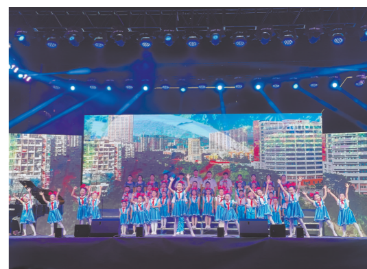
近日,莆田荔城区第六届校园艺术节暨“颂莆田·爱校园”校歌展示文艺晚会在荔城区第一实验小学举行。图为精彩的歌舞表演。 本报记者 林剑波 通讯员 吴悦敏 摄

在宁夏期间,詹金荣还考察了当地的苗木市场,他打算从宁夏引进桃苗、山楂、蟠桃等果树苗木到莆田种植。“希望宁夏特色果树也能在莆田开花结果,让莆田人不出远门,便能品尝到山那边的味道,感受舌尖上的山海情谊。”詹金荣说。