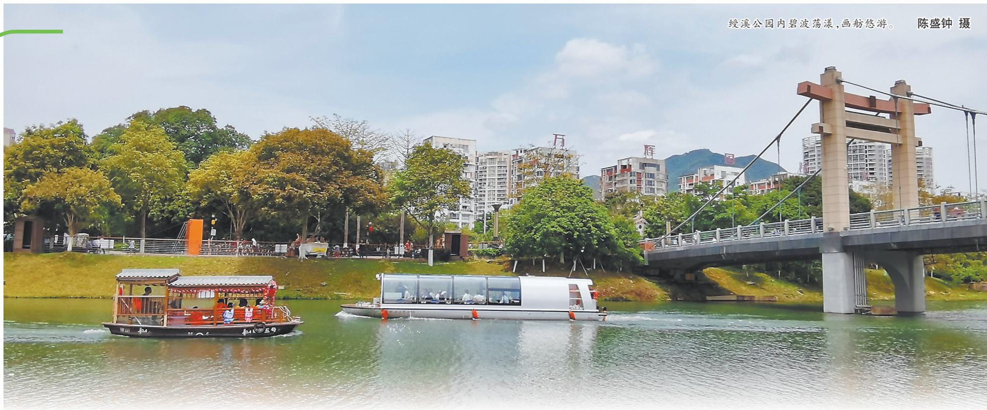
绶溪公园内碧波荡漾,画舫悠游。