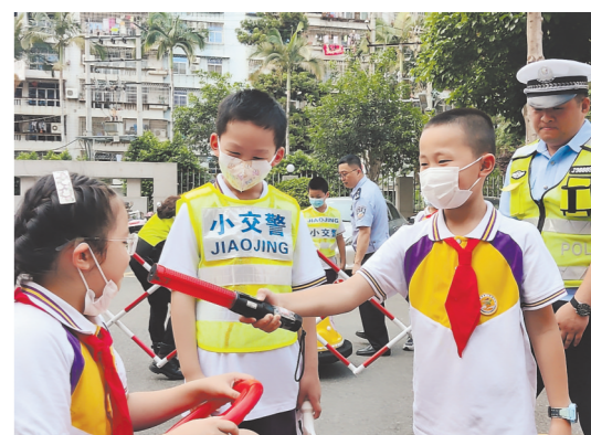
近日,城厢区人民法院交通审判团队联合城厢交警大队,邀请莆田市第二实小和城厢区逸夫实小学生参观交通事故快速处理中心及交通审判法庭,普及交通安全知识。图为学生们现场模拟“查酒驾”。

城厢区积极探索社区绿色低碳发展模式,把低碳示范点创建作为做好“碳达峰、碳中和”工作的重要抓手,将其列入年度生态环保重点工作重点任务。通过调研,该区选取绿色元素鲜明、业态成熟的社区作为试点,分类指导,推进基础设施梯次改造升级,逐步形成由政府指导、社会支持、群众参与的绿色社区发展之路,共同守护城厢美丽家园。