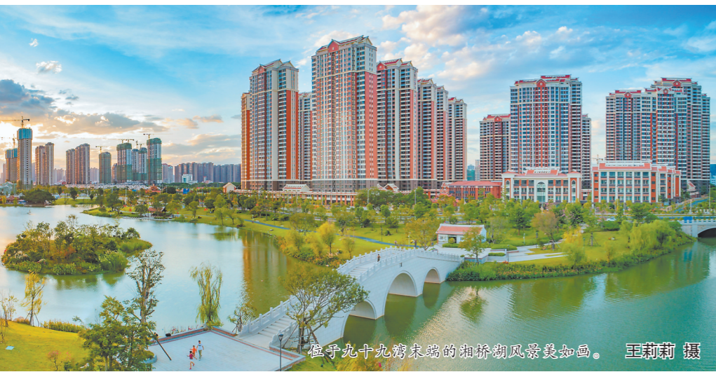
位于九十九湾东端的相桥湖风景如画。