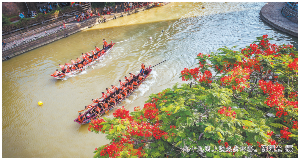
九十九湾上赛龙舟比赛。

作为石化园区内企业生产物料高效传输的核心载体,古雷公共管廊智慧管廊工程项目主要建设智慧管廊综合管理平台及对应的物联网网络配套系统两个部分。下一步,古雷发展集团将以此项目验收通过为契机,充分用好智慧管廊综合管理平台,进一步完善管理平台相对应的物联网及网络配套系统,切实提升公共管廊安全管理水平,更好地服务古雷石化园区公共管廊各使用单位,助力古雷石化产业项目建设提质增效和安全稳定可持续发展。