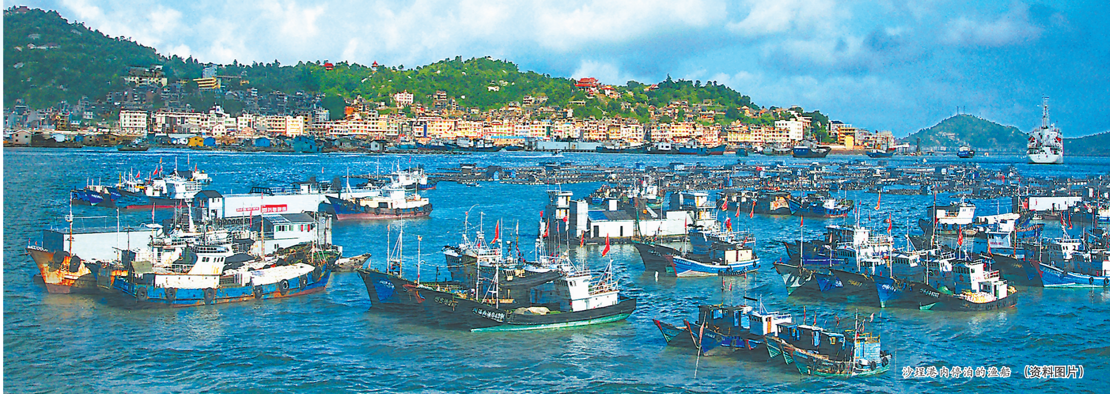
沙埕港内停泊的渔船 (资料图片)