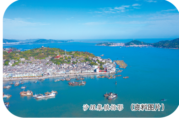
沙埕集镇掠影 (资料图片)