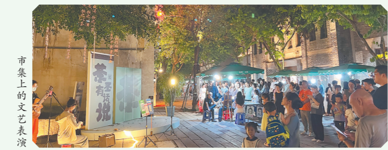
市集上的文艺表演

日前,福州上下杭历史文化街区的独立文创品牌“杭肆”升级为“杭肆·云集”,将继续依托上下杭闽商历史文化背景,创意复兴老字号,创新消费场景,打造以文化互动为核心的IP文化生态体系。