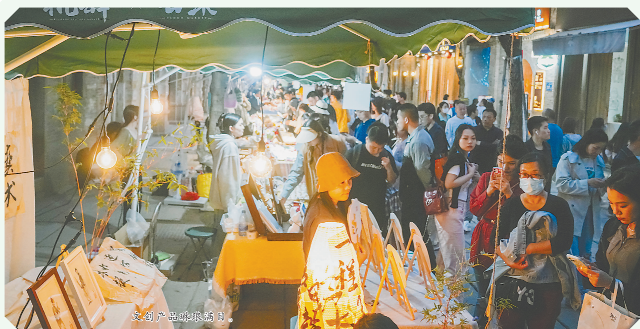
文创产品琳琅满目。

2005年,邵武竹荪产业迈上了发展的“快车道”,到了2012年竹荪种植面积突破1.2万亩。之后,邵武竹荪产业极为“平稳”,到现在为1.4万亩。