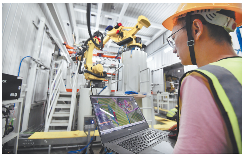
16日,在东南汽车产线改造项目建设现场,工人正在进行数字化、智能化设备安装调试。

沈跃跃要求,妇女和家庭的事,再小也是大事。要站稳人民立场,多做雪中送炭的事,帮助解决实际困难,通过解决问题、满足妇女需求来检验妇联工作成效。要深化调查研究,深入基层,研究新情况、解决新问题、总结新经验、探索新规律,把工作做到妇女群众心坎上。要筑牢桥梁纽带,把党的意志和主张及时传递给妇女群众,把妇女群众的意愿和呼声传递给