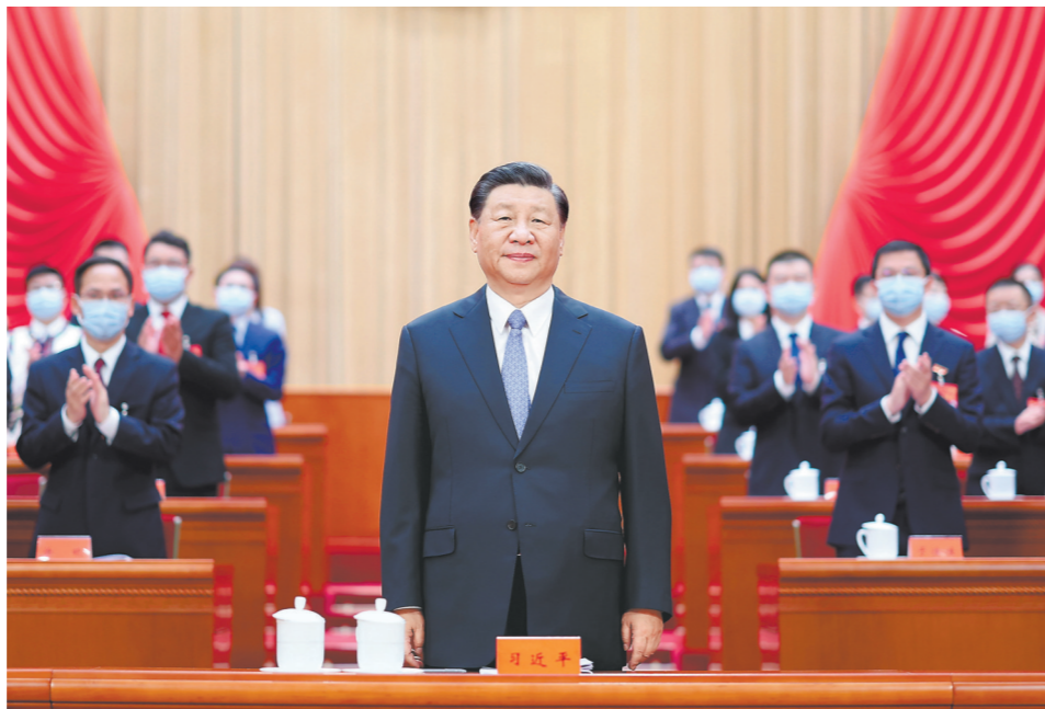
6月19日,中国共产党第十九次全国代表大会在北京人民大会堂开幕。这是中共中央总书记、国家主席、中央军委主席习近平在主席台向与会代表致意。

新华社北京6月19日电 中国共产党第十九次全国代表大会19日上午在人民大会堂开幕。习近平、赵乐际、王沪宁、丁薛祥、李希等党和国家领导人到会祝贺,蔡奇代表党中央致词。