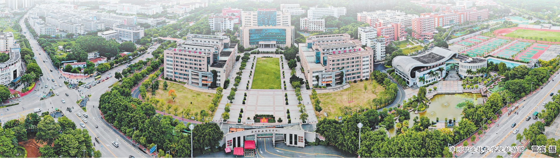
漳州职业技术学院航拍图

“这台三坐标测量机的测量精度相当于一根头发直径的五十分之一,设定编程后可以对工件进行快速自动测量,大大提高复杂形状工件的测量效率与精度。”该校智能制造学院副院长吴海勇说。最近,价值千万元的瑞士GF柔性智能自动化生产线落地漳州职业技术学院,其中包括精密三坐标测量机、三轴高速铣加工中心、精密五轴加工中心、精密电火花特种加工设备、柔性智能自动化系统等设备。这也是漳州职业技术学院建设成为“教育部-瑞士GF智能制造创新实践基地”的重要基础。