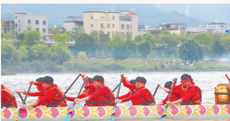
马祖龙舟队的青年队员们在比赛中。