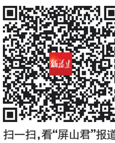
扫一扫,看“屏山君”报道

二是闽越。秦朝末年,闽越族助楚灭秦、助汉灭楚,汉高祖刘邦封闽越头领无诸为闽越王,“王闽中故地”,(下转第三版)