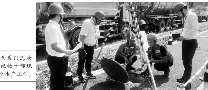
因为厦门海沧城建集团纪检干部现场监督安全生产工作。

“有限空间作业安全风险大,要严格按照规范流程进行审批和施工,确保安全管理措施落实到位。”厦门海沧城建集团纪检干部联合安全管理部门在新阳主排洪渠沿线截污设施现场开展安全生产监督检查时说道。