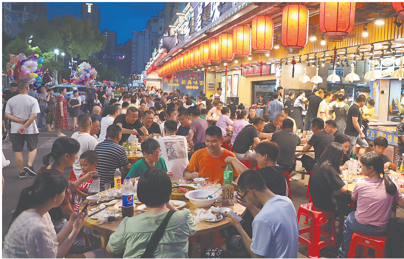
▼华灯初上,霞浦县松港街道太康路美食街人头攒动,琳琅满目的特色海鲜美食吸引游客纷至沓来。