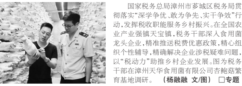
国家税务总局漳州市芩城区税务局贯彻“深学争优、敢为争先、实干争效”行动，发挥税收职能服务乡村振兴。

近日，国家税务总局漳州高新技术产业开发区税务局邀请中小企业代表走进办税服务大厅，担任“税费服务体验师”，沉浸式体验全流程办税，为税费服务“集中会诊”，找问题、提建议。