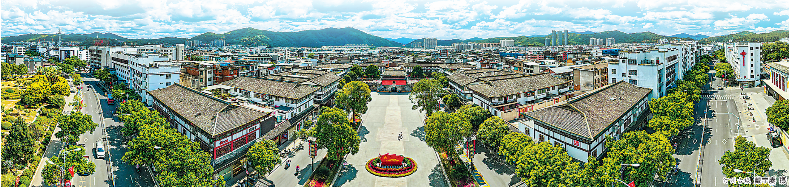
汀州古城