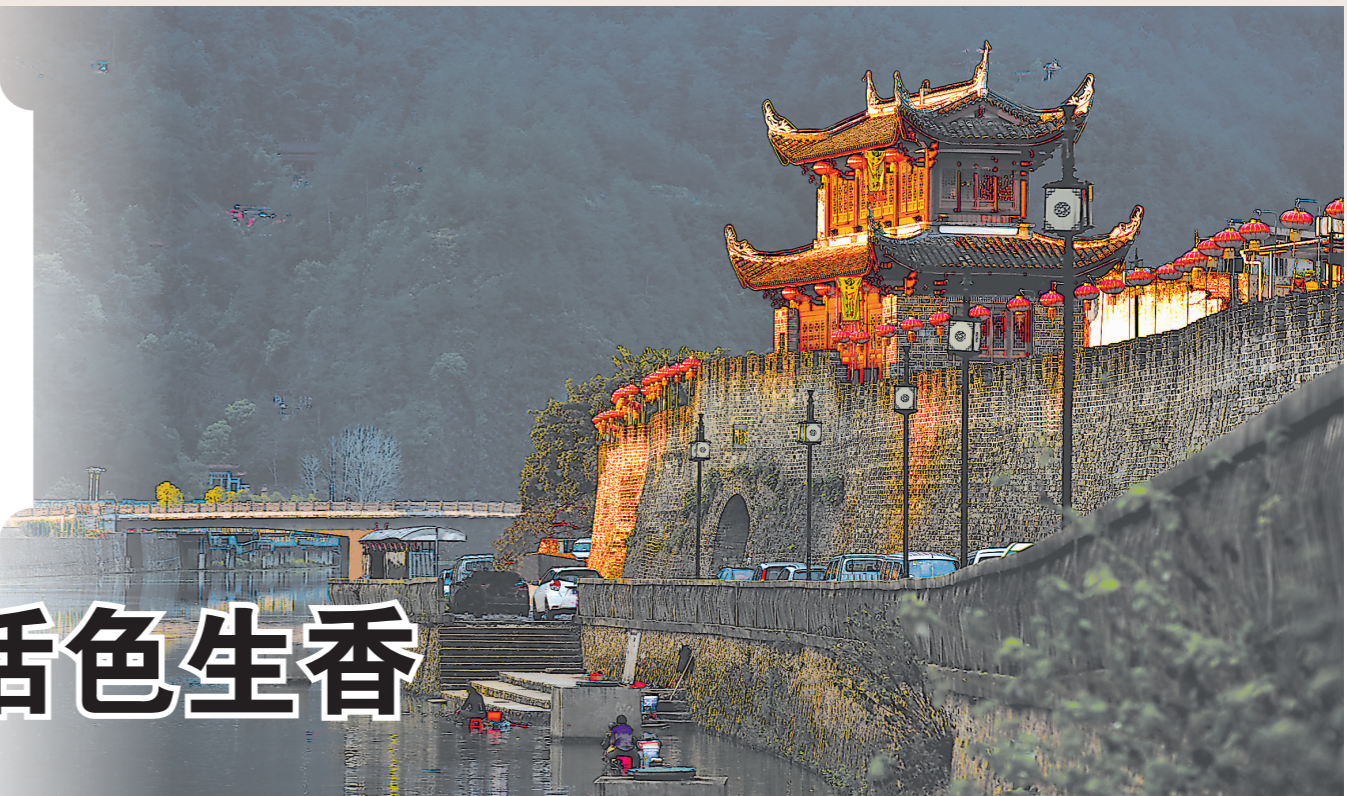
晨曦中的长汀古城墙

一座城、一个县,虽然在福建的版图上是一个面积不大的地方,但它有风景,有文化,还有“味道”。小城故事多,每个故事都不同。晨曦日暮,随星辰淡入灯火。人来车往,挥挥手又是一季。一桩桩、一件件小城故事,让生活在这里的人们收获满足与幸福,也是对远方的人们发出的邀请和召唤。 这个夏天,《深读》带你开启小城之旅。本报记者将深入福建颇具特色的县(市、区),用镜头聚焦小城的发展变迁,用一线的热忱讲述新小城故事,见证小城日新月异的美丽蝶变。 来,让我们一起“行走小城 读懂福建”,打开小城记忆,品读福建地域文化,触摸福建发展脉搏。