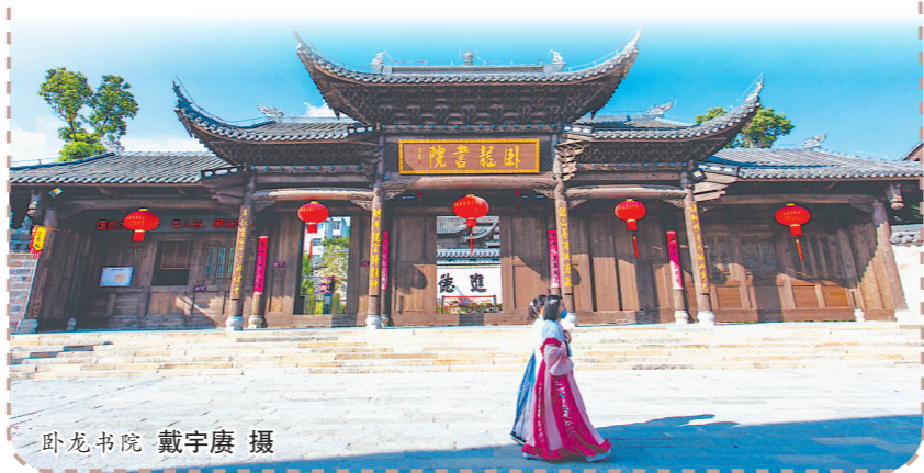
卧龙书院

2020年,长汀古城保护进入新阶段,《龙岩市长汀历史文化名城保护条例》于当年正式颁布实施。