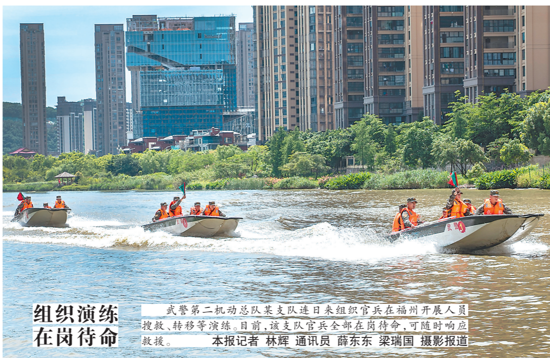
组织演练 在岗待命

武警第二机动总队某支队连日来组织官兵在福州开展人员搜救、转移等演练。目前,该支队官兵全部在岗待命,可随时响应救援。