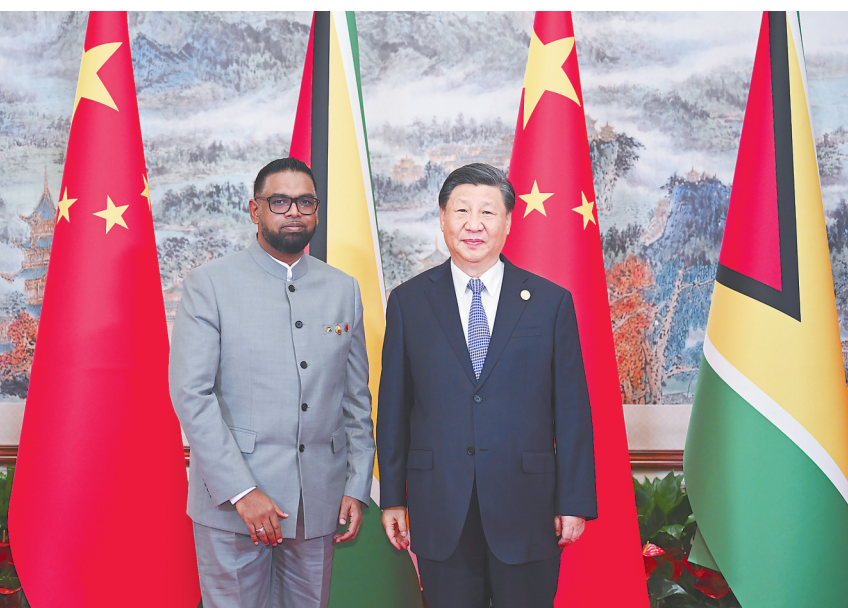
28日上午,国家主席习近平在成都会见来华出席第31届世界大学生夏季运动会开幕式并访华的主亚那总统阿里。