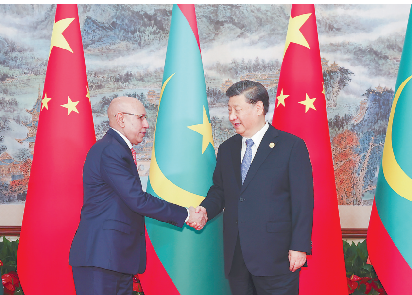
28日下午,国家主席习近平在成都会见来华出席第31届世界大学生夏季运动会开幕式并访华的毛里塔尼亚总统加兹瓦尼。