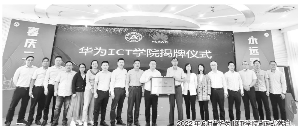
2022年6月“华为ICT学院”正式落户。

党建是高校的政治生命线。多年来,物智学院党总支坚持党建与业务的相互促进和有机融合,产学研深度融合创新构建出“1354”的党建工作模式,紧紧抓住党建这个中心工作,不断深化“1+N”全员导师制,贯彻实施“一体三维、四合一”学生素质养成体系,形成“五模块、四目标”校园“IAI-爱”文化品牌建设体系,以高质量党建推动高质量发展,荣获福建省先进基层党组织、福建省高校党建工作首批标杆院系、福建省五一先锋号等荣誉称号,在高校党建工作评选中,获得“党员好故事”等优秀典型。