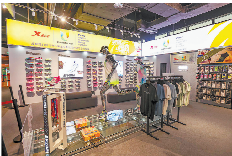
大运村内的特步专卖店