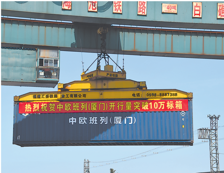
龙门吊吊起中欧班列集装箱。

为保障中欧班列(厦门)顺畅开行和通关,各个部门联合发力,持续给予多方面支持。其中,南昌铁路局相关车务段及海沧火车站合理设计班列路线方案,干支结合、多向并举,充分发挥铁路全天候、全方位联控交互优势,克服公路接驳运力不足、平板车汇集集结较慢、集装箱堆放空间不足等问题,对货物实施优先装卸、优先挂运、优先交接;厦门海关发挥国际贸易“单一窗口”平台优势,实现跨部门无缝对接,不断精简企业申报与查验手续,实现货物“即到即查即放即转”,并开辟“绿色通道”,采取便捷转关模式,保障班列“一次报关、一次查验、全线放行”,全面提升中欧(厦门)班列综合服务能力。