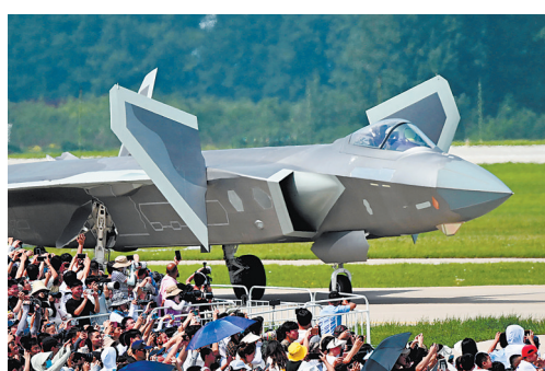
在空军航空开放活动上,完成飞行展示的歼-20飞机从观众前滑向停机坪(7月26日摄)。