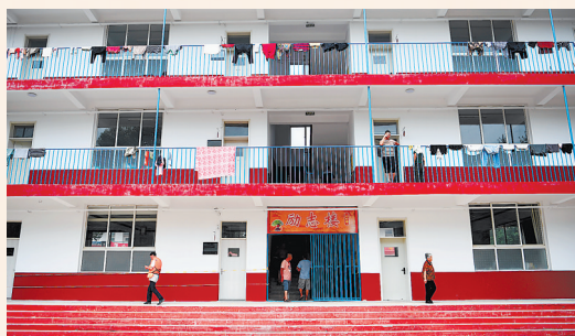
3日,受灾群众在涿州市第三中学安置点内休息。