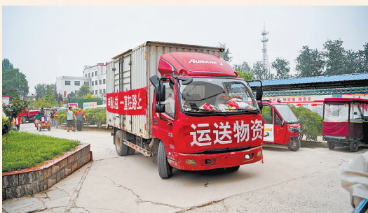
3日,运送物资的车辆驶入涿州市第三中学安置点。

更多救援物资正在路上。应急管理部会同国家粮食和物资储备局向灾区紧急调拨2万件中央救灾物资,支持地方妥善保障受灾群众基本生活;国家发展改革委下达1亿元投资支持北京、河北暴雨洪涝灾害灾后应急恢复重建;财政部、交通运输部紧急下达公路应急抢通补助资金3000万元等。