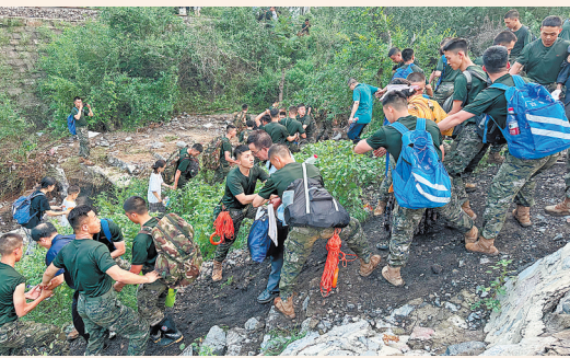
2日,Z180次受困列车的旅客在武警北京总队机动第三支队官兵的帮助下徒步前往转运客车。