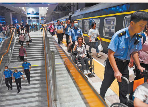
3日,K396次、Z180次列车的滞留旅客到达北京丰台站。