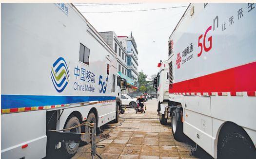
3日,应急通讯车辆停靠在涿州市第三中学安置点外。