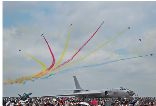
在空军航空开放活动上,观众现场观看飞行表演。