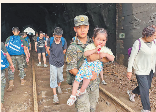
2日,受困列车的旅客在武警北京总队机动第三支队官兵的帮助下徒步前往转运客车。