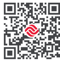
扫码观看更多融媒报道

“接下来,我们将积极构建泉州优品海外营销网络,不断完善跨境电商产业链和生态圈,加强跨境电商供应链体系建设,让更多泉州产品走向世界。”