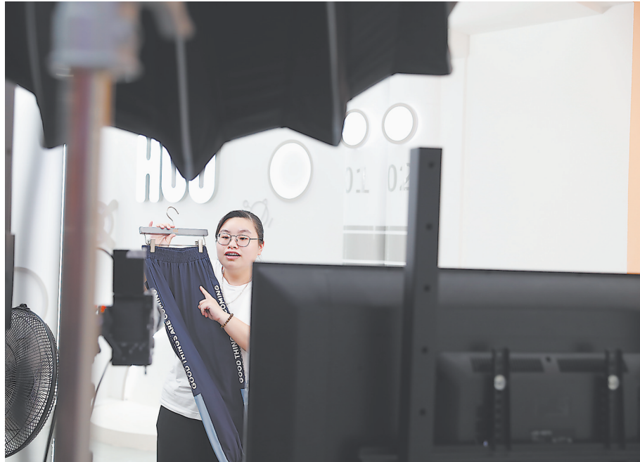
互杰商贸有限公司的直播团队正在直播带货。