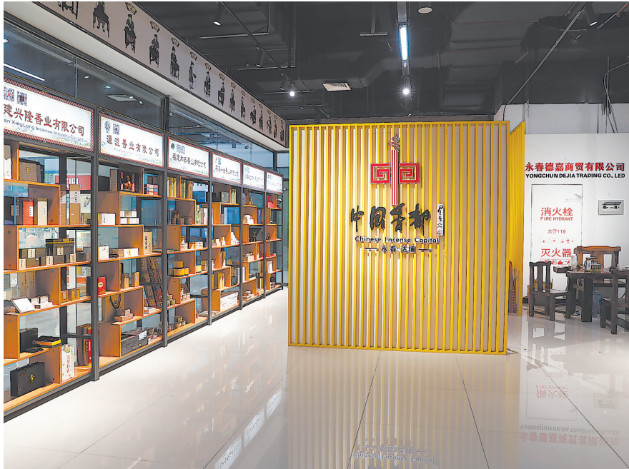
展馆内并未见一人,只有桌上摆放的名片和供咨询的微信二维码。