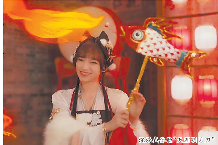
沉浸式体验“天涯明月刀”