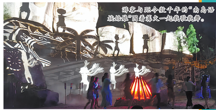
游客与距今数千年的“南岛语族姑娘”围着篝火一起载歌载舞。