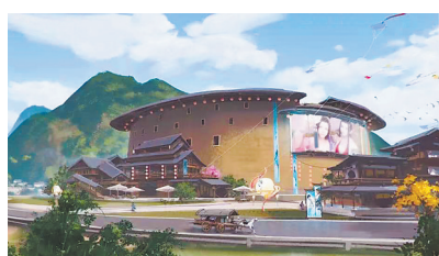
“天涯明月刀”环兴楼外景