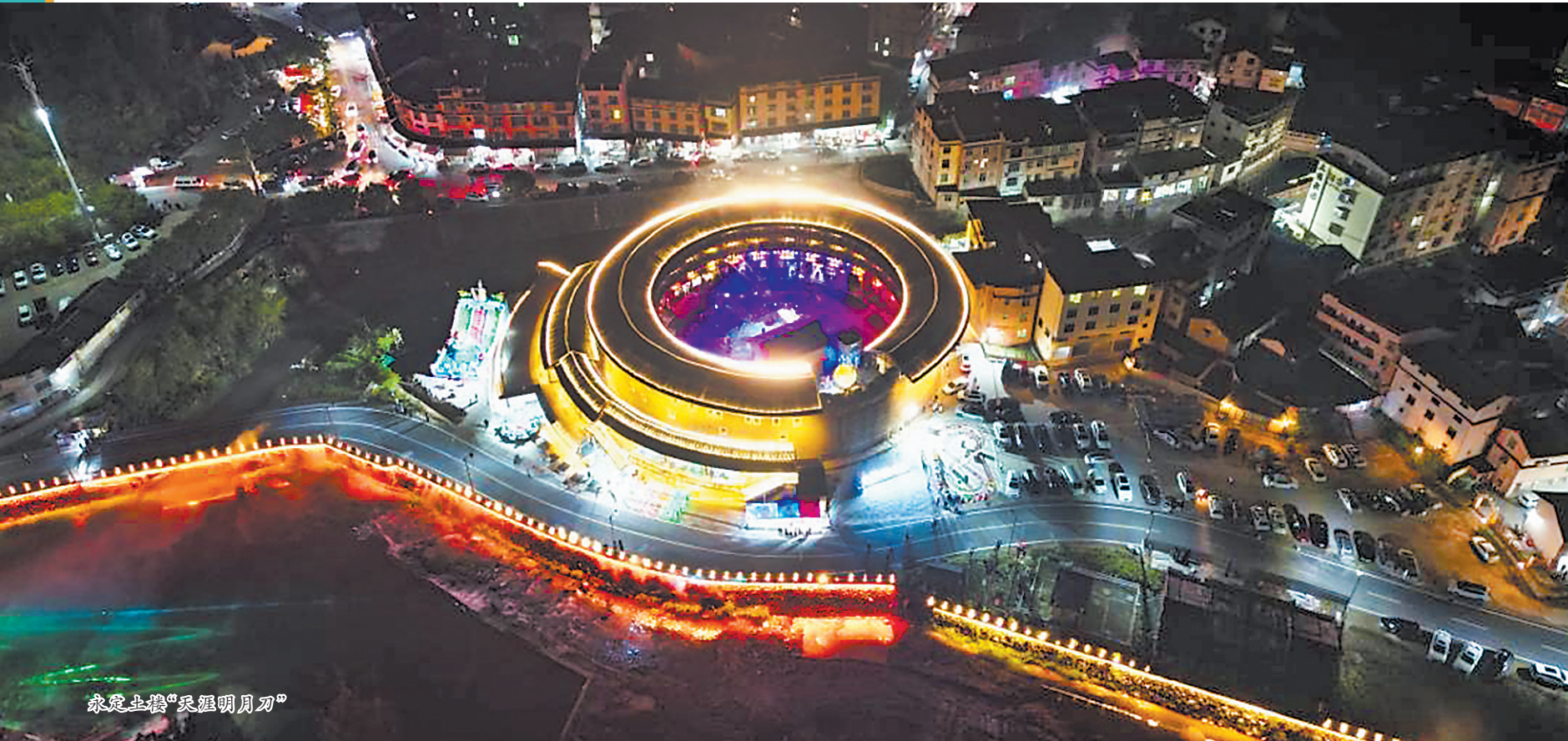
永生生态“天涯明月刀”