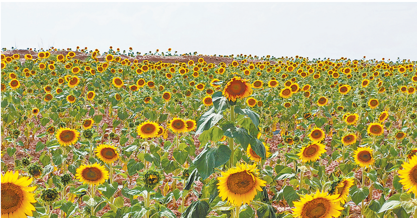
经过治理,盐碱地上油菜盛放。(资料图片)

20多年前,一场跨越山海的东西部扶贫协作“接力长跑”开启。如今,闽宁协作已从单向扶贫,拓展到两地经济社会建设全方位多层次、全领域广覆盖的深度协作。