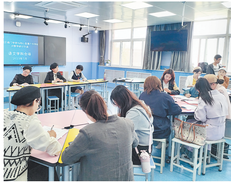
南门学校与同心六中的教师们开展集体教研。