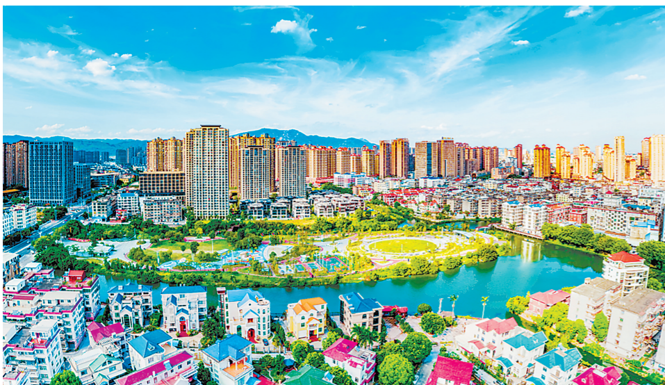
涵江区西河公园

8月4日,在涵江区梧塘沁后片区改造项目现场,工人们正有条不紊地进行施工作业。“在确保安全和质量的前提下,我们加大大